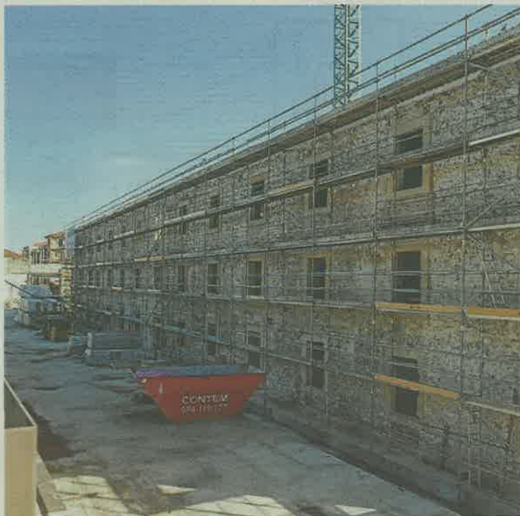
Obras en el edificio de Tabacalera.