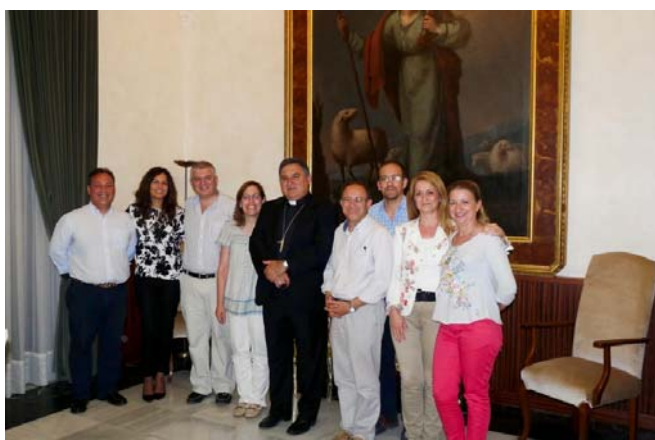
11: La CVX con el obispo de Jerez

Asimismo se le puso de manifiesto la vocación diocesana del Seminario de Espiritualidad Ignaciana en la Parroquia Madre de Dios. Poner al servicio de la