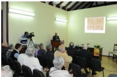
2: Conferencia del Provincial de España

Además, el viernes 6, el grupo Troysteatro, en la iglesia del monasterio de las