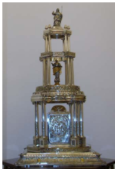
5: Custodia de San Hipólito, Córdoba

http://sevilla.abc.es/provincia-alcala-de-guadaira/20140606/sevi-corpus-alcala-procesionara-custodia-201406061125.html