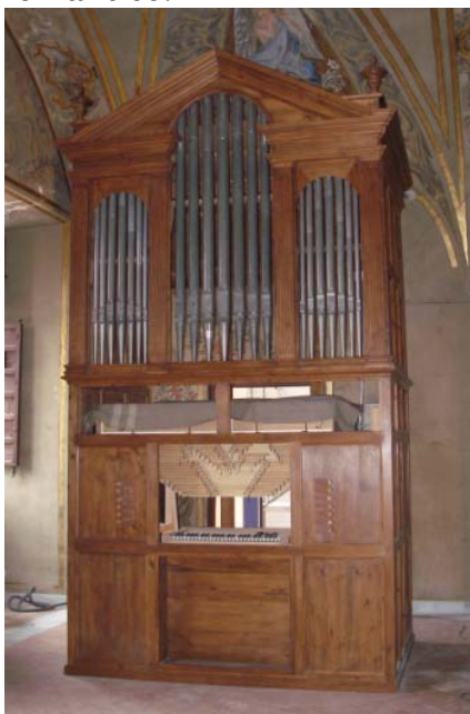
7: San Luis de los Franceses, Órgano

En un comunicado, la institución provincial ha indicado que esta intervención ha permitido descubrir un órgano barroco, cuyos orígenes dieciochescos estaban «escondidos» dentro de lo que, para los estudiosos sevillanos, era un órgano romántico.