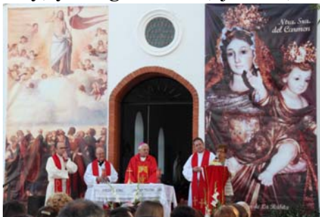
13: Misa presidida por el obispo de Jaén