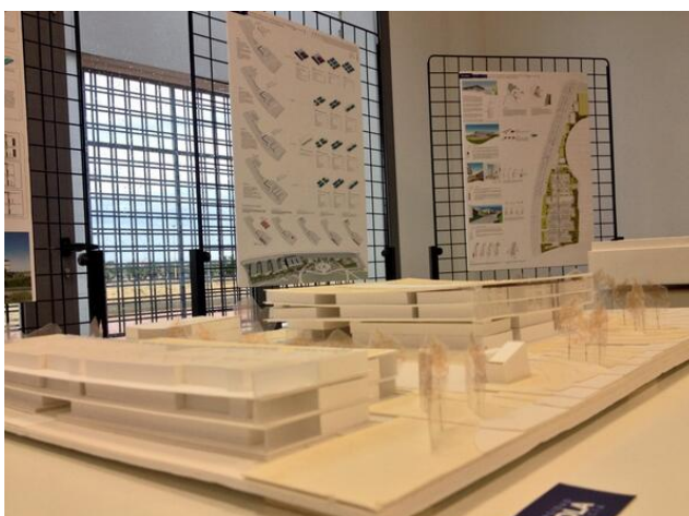
8: Maqueta del campus Entrenúcleos, Dos Hermanas

Las obras, objeto de un procedimiento en el que se invitó a 15 empresas, se otorgan con una concesión sobre cuatro parcelas y comprenden la unificación de las mismas, con actuaciones urbanísticas, de limpieza y desvío de servicios.