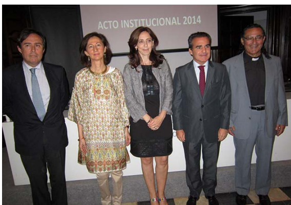
4: Los galardonados por la Fundación Madariaga

«Un poco de lo tuyo es todo para ellos». Ésa es la filosofía de la Fundación Prodean, institución solidaria nacida en Sevilla en 1990 que el día 4 celebró su primer acto institucional. El objetivo, poner sobre la mesa la labor que hacen , centrada en ayudar a los niños ingresados en hospitales, a los mayores, a la población gitana o a los países en vía de desarrollo, entre otras materias. Hasta el momento han favorecido a más 12.000 beneficiarios directos y