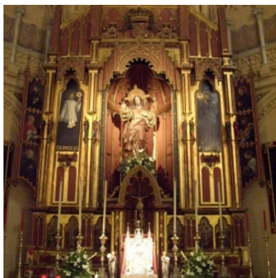
12: Iglesia del Sagrado Corazón,

El jueves 19 de junio comenzó la novena al Sagrado Corazón. La procesión tendrá lugar en el día de su festividad, 27 de junio.