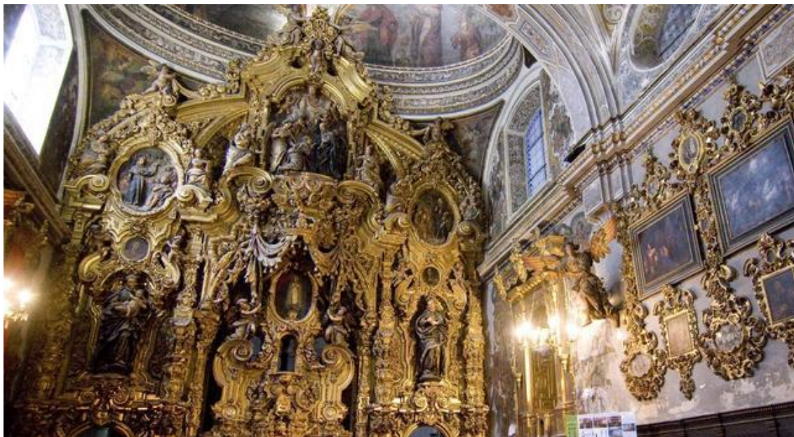
6: Capilla doméstica del antiguo noviciado San Luis, Sevilla

"Además, la Diputación acaba de entregar el proyecto que afecta a una serie de intervenciones en infraestructuras: reparación de las cubiertas inclinadas y cubiertas planas (azoteas), montera de cristal y saneamiento de patios y cornisas", anuncia la Diputación. En total, estos trabajos, que comenzarán en octubre y que durarán cuatro meses, aproximadamente, requerirán una inversión de 441.000 euros. "Con éstos se garantiza la estabilidad estructural y la estanquidad frente a las filtraciones".