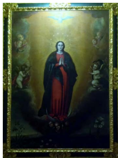
14: Inmaculada de Sánchez Cotán

12 En la Comunidad del Sagrado Corazón de Granada se ha llevado a cabo la restauración del gran cuadro de la Inmaculada que se atribuía a Roelas y que se encontraba en una situación deplorable. Las restauradoras, buenas especialistas en arte, aseguran, y con buenos argumentos, que el autor de la obra es en realidad Sánchez Cotán, con lo que el valor de la misma se acrecienta. En el marco se ha encontrado una inscripción que informa de que el primer lugar en el que estuvo la obra fue el monasterio de San Jerónimo. A nuestra casa llegó desde el local de las antiguas congregaciones marianas.