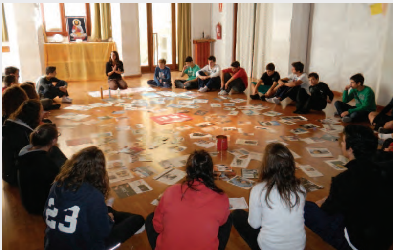
Espacio joven - Cueva de Manresa