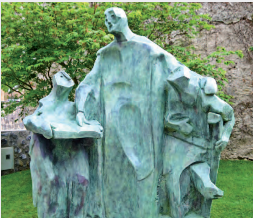
Azpeitia - Hospital de Pobres. S. Ignacio enseñando a un niño y acompañando a un enfermo