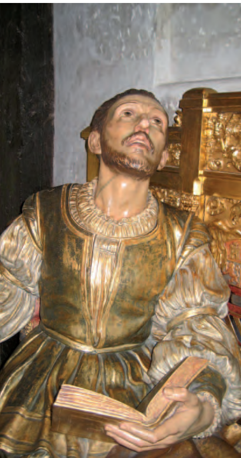
Capilla de la Conversión. Loyola.

En algunas de las actividades enumeradas conviene buscar en el web del Centro de Espiritualidad correspondiente, concreciones de fechas, inscripción, etc. (véase también www.espiritualidad.ignaciana.org ).