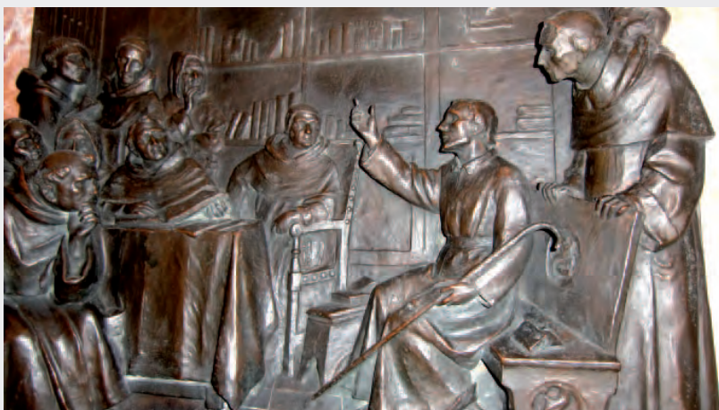
Salamanca. Ignacio en el Convento de los Dominicos