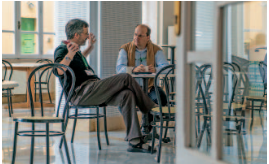
Dos jesuitas, en una conversación durante la Congregación General

Uno de los esfuerzos en los que la Compañía está hoy embarcada es en