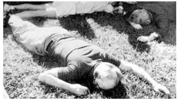
Ellacuría yace con un tiro en la cabeza, tras sufrir el atentado.

EL ACTA DEL ASESINATO DE LOS JESUITAS. La prueba del asesinato es un documento inédito donde se puede leer cómo, dónde, cuándo y quiénes planificaron el asesinato. El texto da fe de que fue el Estado mayor de El Salvador, en concreto el general René Ponce, el encargado de dar la orden.