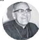
Monseñor Oscar Romero.