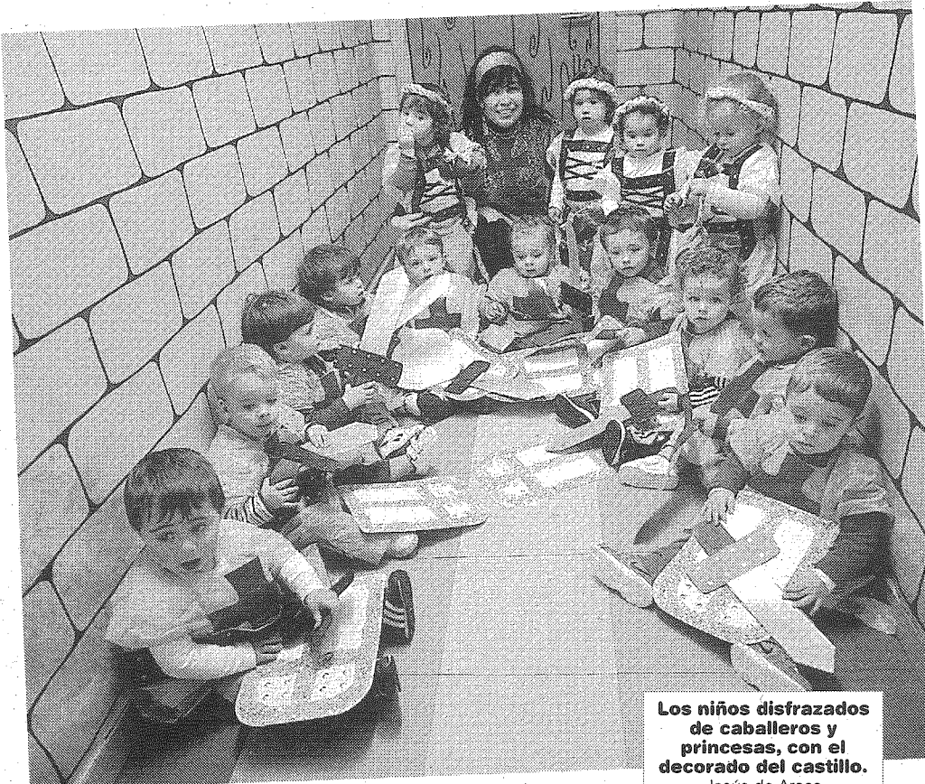
Los niños disfrazados de caballeros y princesas, con el decorado del castillo. Jesús de Arcos.

La escuela infantil "Los Pitufos" de Vigo aprovechó como cada año el carnaval para convertir la guardería en un lugar muy especial para los niños. A lo largo de tres semanas, los niños con sus profesores convirtieron la escuela en un precioso castillo trasladando todas sus actividades y juegos a aquella época. Así, los niños aprendieron canciones, juegos, cuentos, costumbres y vocabulario correspondiente a aquella época lejana y convirtieron el aula de psicomotricidad en un jardín con su castillo donde dieron vida a esos personajes y sus aventuras con sus circuitos y ejercicios. En las actividades de plástica realizaron los disfraces de caballeros y princesas con todos sus complementos que lucieron el martes de Carnaval.