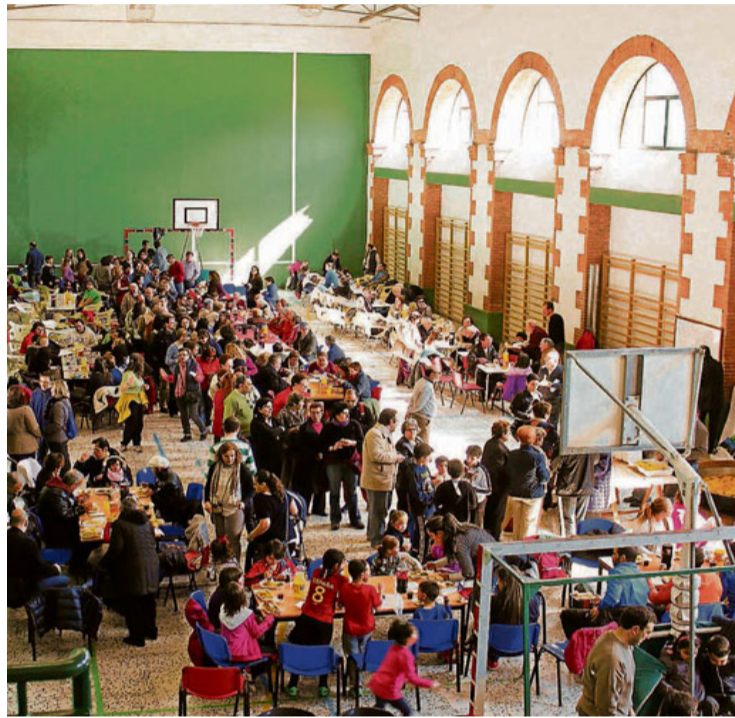
Paella en las fiestas de San José del domingo pasado.

Y para ello organiza diversas actividades a lo largo del año. Además de los campeonatos deportivos de San José, que se han venido celebrando durante los pasados fines de semana, en Navidades se organi-