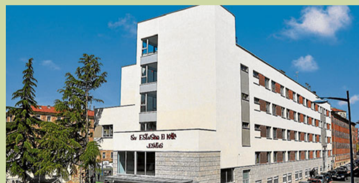
Vista exterior del colegio San Estanislao de Kostka de Salamanca.