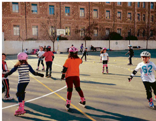
El patinaje es una alternativa de deportiva y de ocio.

nuestras capacidades físicas, son algunos de los beneficios de la práctica. A través de ejercicios y tablas practicados en grupo en el cual también tienen cabida la diversión y el juego.