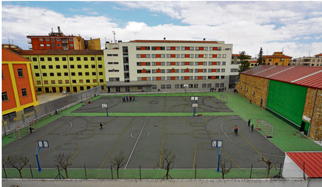
Vista del patio del Colegio San Estanislao de Kostka.