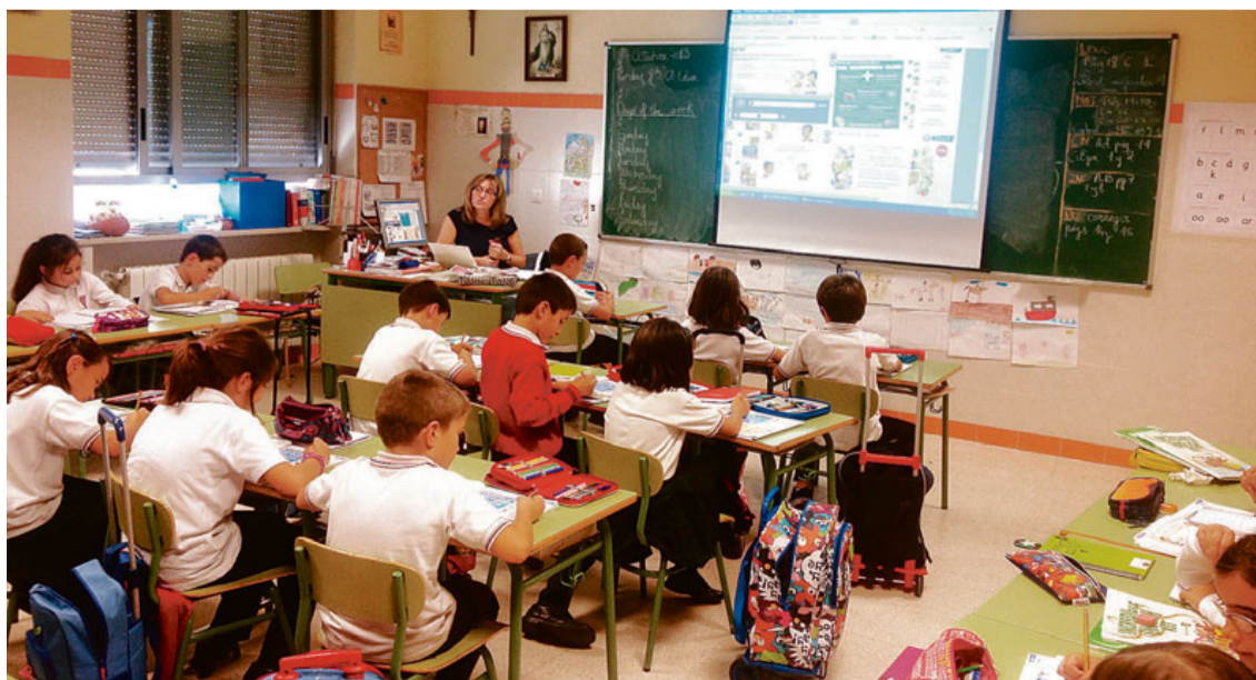
Una clase de "Sciences" en Educación Primaria mediante el uso de las TICs.

Y otro proyecto fundamental es el diseño de un Proceso de Mejora de dos focos competenciales: Comprensión Lectora y Resolución de Problemas, que afecta a toda la enseñanza Primaria y Secundaria.