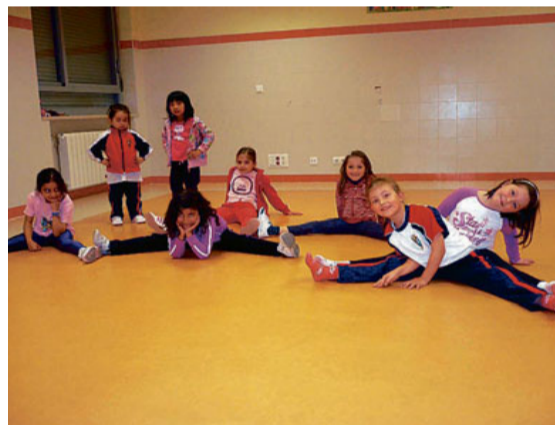
Alumnos realizando ejercicios de flexibilidad y ritmo.