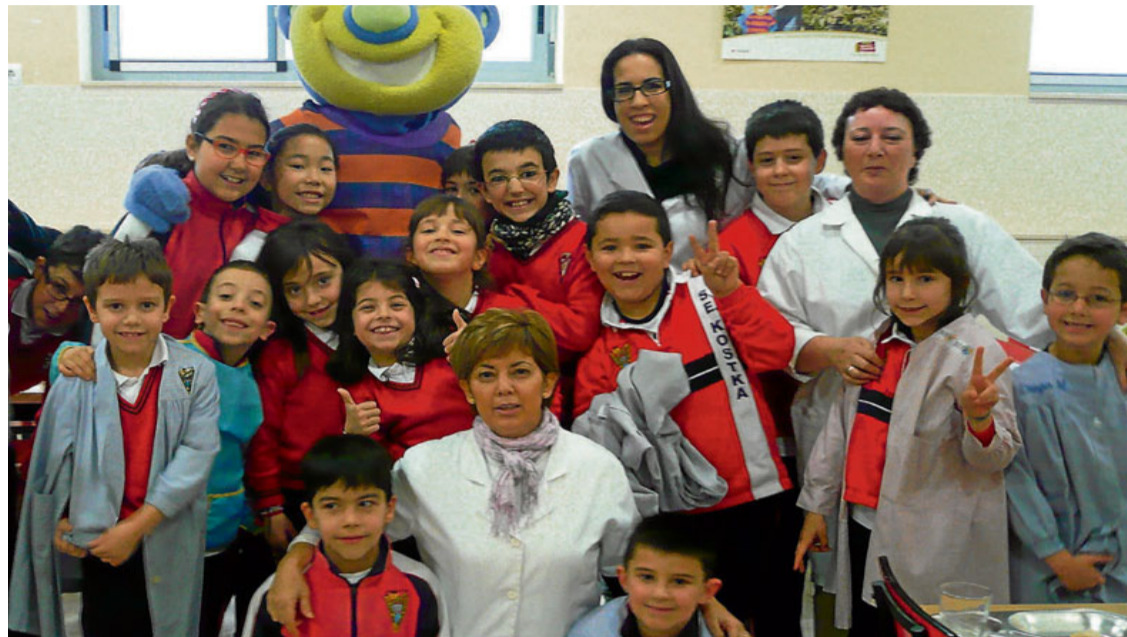
En el comedor con nuestra mascota "Spyke".

TAICHI. Las disciplinas de cuerpo y mente, el equilibrio y canalización de nuestra energía, el control y mejora de