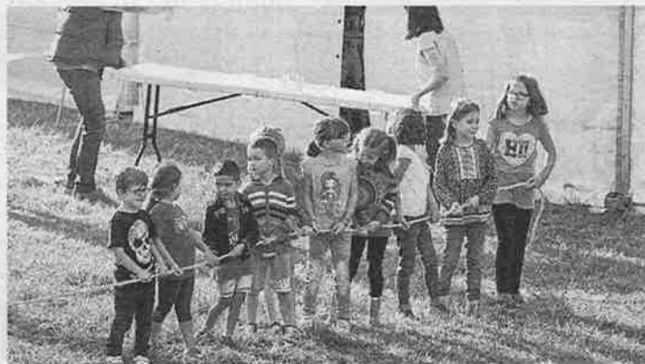
Pequeños, en uno de los juegos de Castiello.