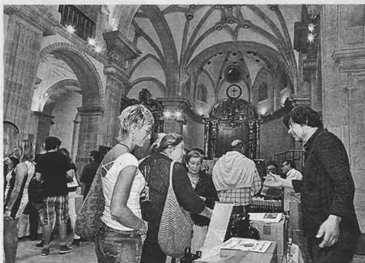
Una mujer, en uno de los puestos de cata.

La Colegiata de San Juan Bautista se convirtió ayer en el epicentro de la celebración de una nueva edición, ya la sexta, del Salón Internacional de las Sidras de Gala. El céntrico recinto acogió una cata abierta al público desde el mediodía hasta las nueve de la noche en horario ininterrumpido. Los asistentes pudieron disfrutar de una amplia variedad de sidras europeas, de enorme calidad y distinto sabor. Al pago de 5 euros, los asistentes al evento recibían una copa con la que pudieron degustar destacados caldos de manzana. El Salón cierra su sexta edición con una jornada de sumilleres que se celebra en un lugar de CAstiello de Bernueces.