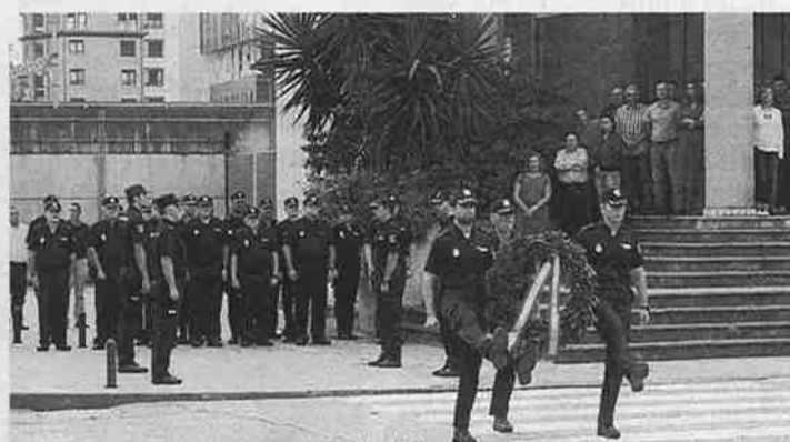
Agentes, en el acto de homenaje a los fallecidos.