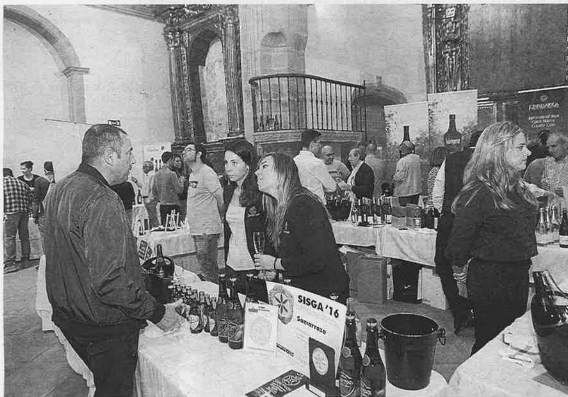
Visitantes a la cata de sidras de gala, ayer, en el colegiata de San Juan Bautista.