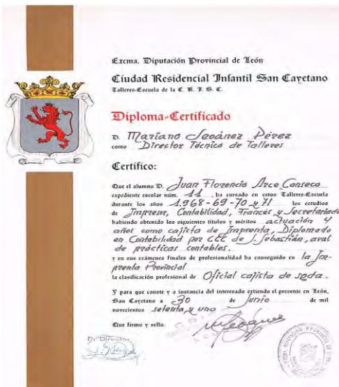
Img. 4.- Diploma de CCC

He aquí dos muestras fehacientes de las “titulaciones para Oficiales” que tanta ayuda prestó para su inserción en el mundo laboral a los muchachos de la CRISC que no habían podido seguir una formación Profesional reglada, en los años previos al desarrollo completo de la nueva Ley de Educación (Ley Villar Palasí).