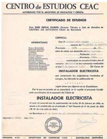
Img. 3.- Diploma CEAC