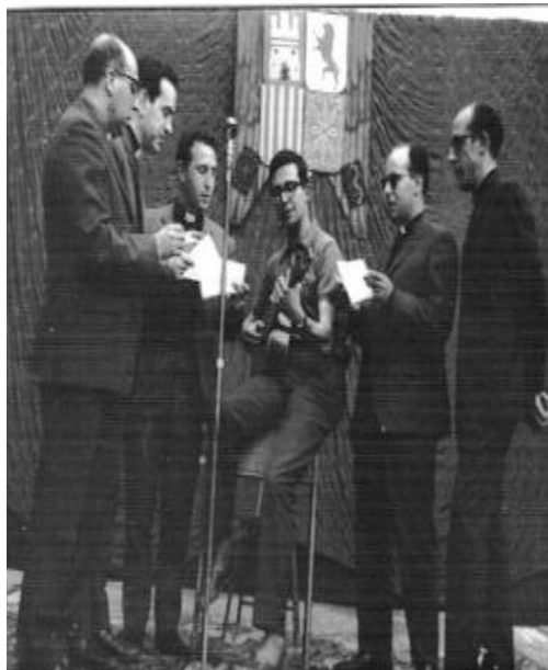
Img. 8.- Grupo de Jesuitas cantando en el teatro para los internos (hay alegría y cercanía)