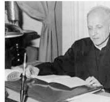
Lectura en su despacho.

la verdadera misión de la Compañía, una mera claudicación frente al comunismo. Estos críticos resumían su pensamiento con la frase: "Un vasco creó la Compañía, y un vasco la destruirá". A pesar de esta oposición, alimentada por unos medios de comunicación que amplificaron la imagen de conflicto entre la Compañía y el Vaticano, Arrupe no desfalleció en su empeño.