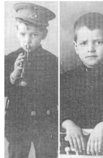
Arrupe nació en la calle Pelota de noviembre de 1907. Imágenes de

Según Arrupe, la Iglesia no podía dar la espalda a las injusticias humanas, y debía ser verdaderamente profética, denunciando cualquier injusticia, y tratando de transformar el mundo en un lugar más justo. Sin embargo, para algunos críticos del general jesuita, el giro social significaba olvidarse de la fe y abandonar