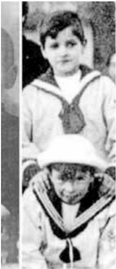
Bilbao el 14 de su infancia.