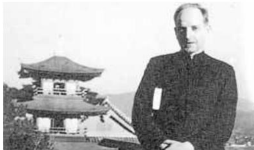
En 1938, el padre Arrupe fue destinado a la misión de Japón donde le tocó vivir el bombardeo atómico de Hiroshima.