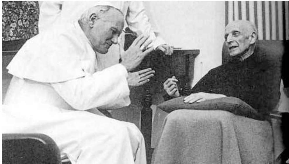
La relación de Arrupe con Juan Pablo II fue poco fluida.