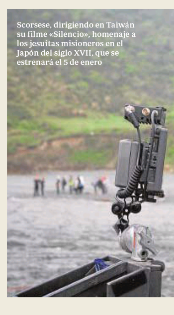
Scorsese, dirigiendo en Taiwán su filme «Silencio», homenaje a los jesuitas misioneros en el Japón del siglo XVII, que se estrenará el 5 de enero