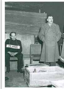
En Japón, a donde llegó en 1938.