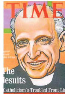
Portada de 'Time' en 1973.

Lo que de verdad le marcó fue vivir la terrible experiencia de la bomba lanzada por los americanos