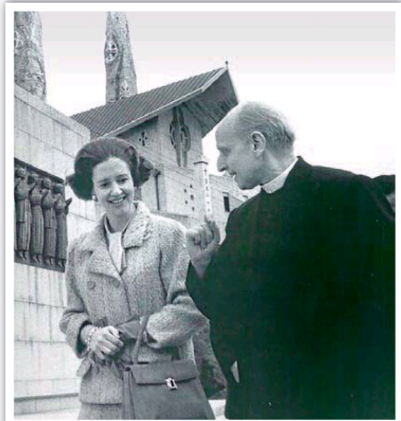
Arrupe con la reina Fabiola de Bélgica.